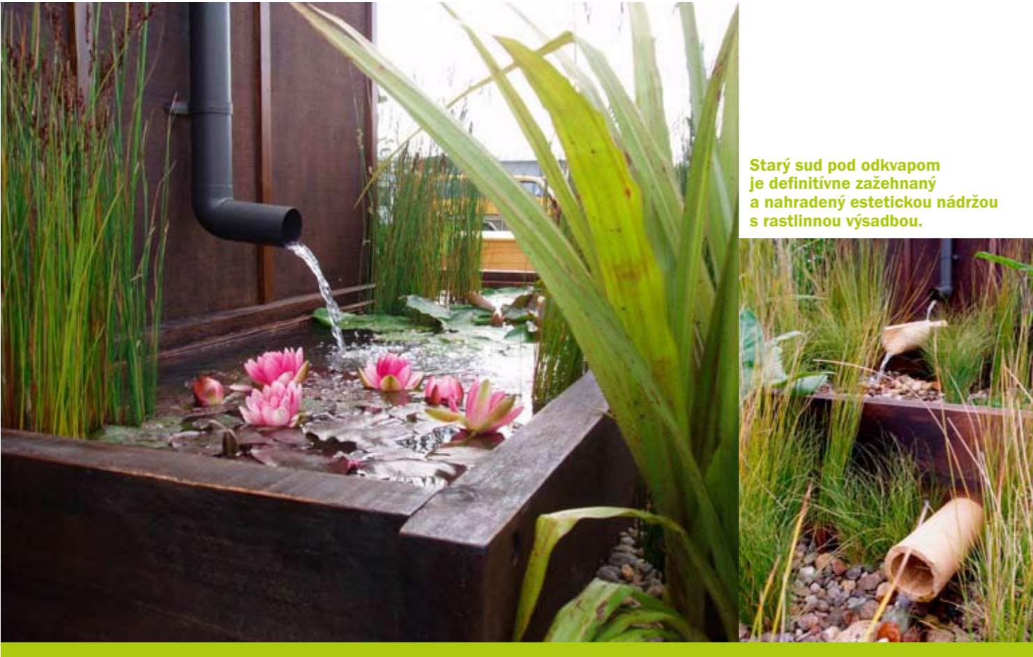
Starý sud pod odkvapom je definitívne zažehnaný a nahradený estetickou nádržou s rastlinnou výsadbou.

Zdá sa, že železničné podvaly nepovedali posledné slovo ani na Novom Zélande.